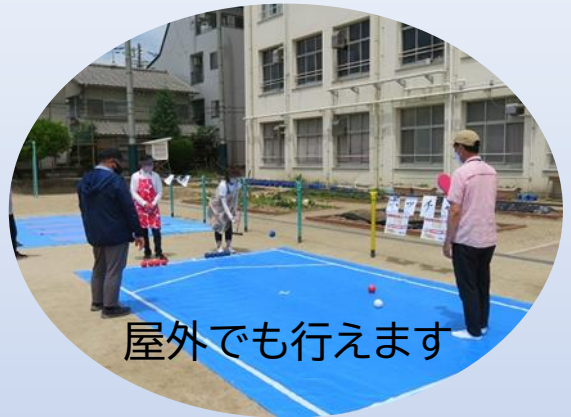
屋外でも行えます

ジャックボール(目標球)と呼ばれる白いボールに、いかに近づけるかを競います。 赤・青2チームに分かれ、それぞれ6球ずつのボールを投げたり転がしたり、他のボールに当てたりして、ジャックボールをねらいます。 上から投げて下から投げて、あるいは蹴ってもOKです。